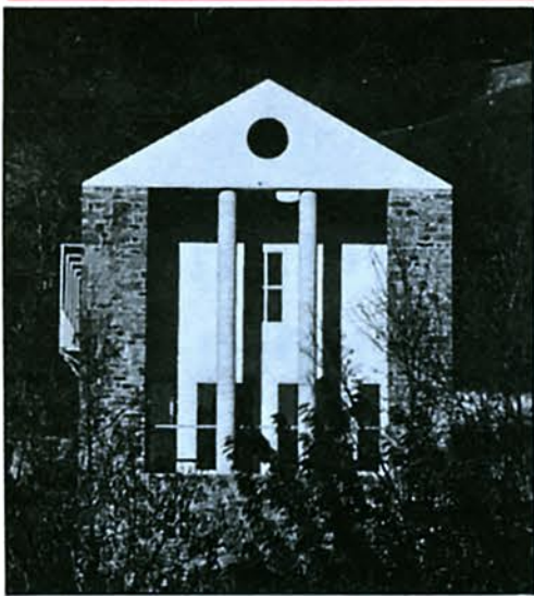
La Casa Maggy (1980), au Tessin. Meilleur exemple de la production Campi-Pessina-Piazzoli, où l'architecture moderne se marie à la tradition vernaculaire locale.