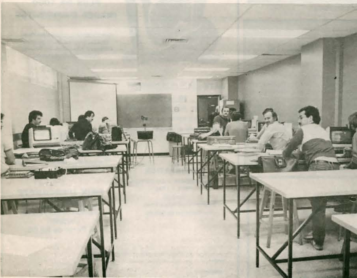
Vue de la salle de contrôle par terminaux, qui sert à la fois aux certificats en instrumentation, en micro-processeurs et en télécommunications.

Il va sans dire que les cours de langues ajoutent à la qualité et à la culture personnelle de l'étudiant, e et lui assurent un cheminement académique plus complet. Aussi, un comité du département de linguistique se penche présentement sur cette question afin d'étudier les possibilités de développement des cours de langues à l'UQAM en termes de moyenne-cible et de nombre de cours offerts, compte tenu de la demande.