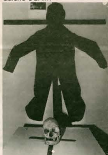
Le phénomène Vaudou à la Galerie UQAM.

l'extérieur, de professeurs, d'étudiants, du ministère des Communautés culturelles et de l'Immigration du Québec, etc... a rendu cette exposition possible à la Galerie UQAM.