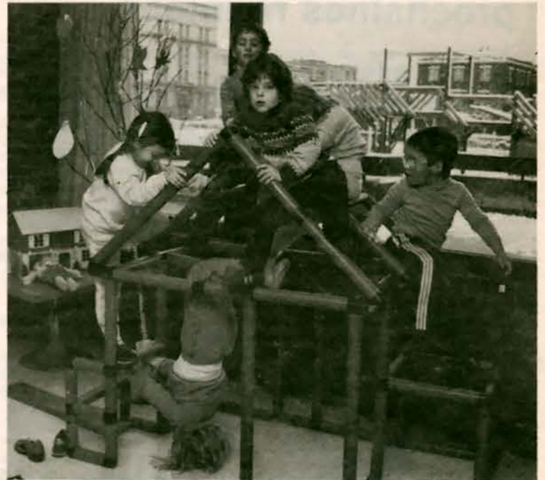
Jeux d'enfants à la garderie MAMUSE.

enfants chaque soir, mais tout dépend des horaires de chacun. Vaut mieux discuter à partir d'une base hebdomadaire; alors il nous faut quelque 70 enfants-semaine."