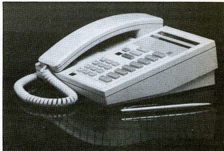
L'Unity Plus pour tous.

interurbain. Sur la base d'une analyse de leurs besoins, les unités administratives recevront, début juin, un complément budgétaire destiné à défrayer les coûts de ces appels; chaque unité aura donc à déterminer quelles personnes sont autorisées à effectuer des appels tarifés; etc.