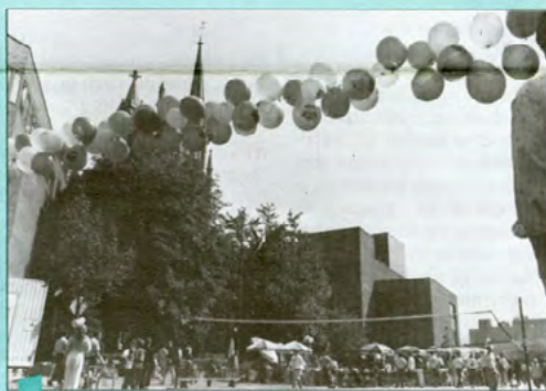
"Une réussite extraordinaire", s'exclame la responsable du service d'animation communautaire. Elle parle des festivités de la rentrée 89 qui ont eu lieu, rue Sainte-Catherine, le 12 septembre dernier. Environ 240 personnes se sont inscrites aux activités participatives. Le tournoi de volley-ball a attiré dix équipes et le collectif de Peinture en direct a permis à chacun de donner son petit coup de pinceau. Les spectacles, le tournoi d'échecs et le souper en plein air ont aussi attiré beaucoup de monde. Même le soleil était au rendez-vous!