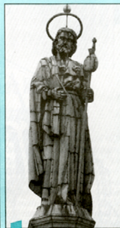
Saint-Jacques le majeur, 1889.