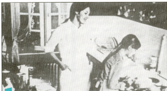
Service des archives de l'UQAM

Dès les débuts de l'UQAM, la problématique féminine fut abordée comme sujet d'études en soi. Une première série de cours, à l'automne 1972, portant sur l'histoire et l'analyse de la condition féminine, est patronnée par le département d'histoire. L'idée et l'élaboration du projet émanent d'un groupe de professeures de diverses disciplines: histoire, sociologie, psychologie génétique, information culturelle, littérature, sexologie, économique. Quelque 150 étudiants, es (80% de femmes) s'inscrivent au cours dispensé sous forme d'ateliers et dont les thèmes s'articulent autour de la Femme et la politique, la Femme et le Conditionnement social, la Femme et le Travail, la Femme et l'Histoire, la Femme et la Sexualité.