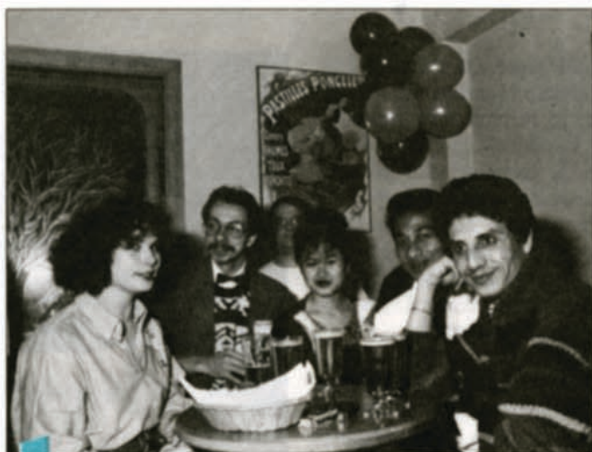
Quelques participants à la soirée 5e anniversaire du certificat en gestion des documents administratifs et des archives.