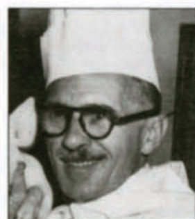
La bourse McAbbie