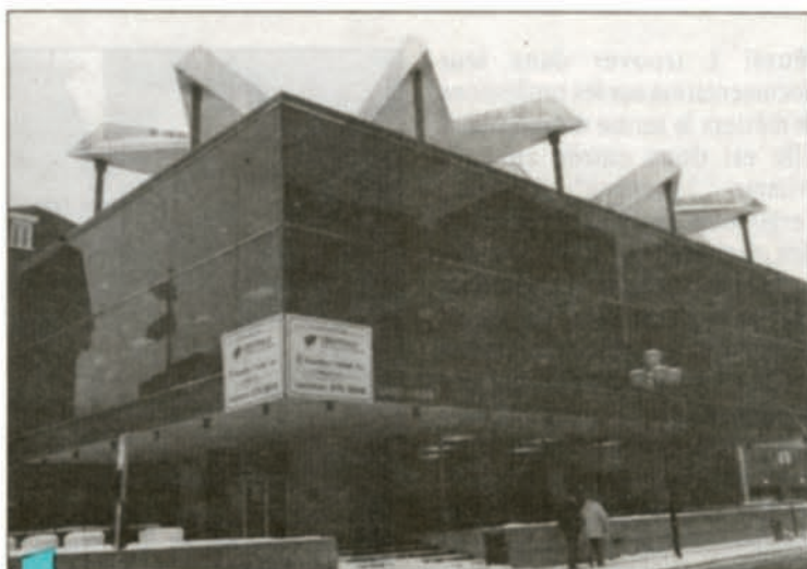
L'ancien édifice de l'Ambulance Saint-Jean change de look pour accueillir le personnel de l'UQAM.