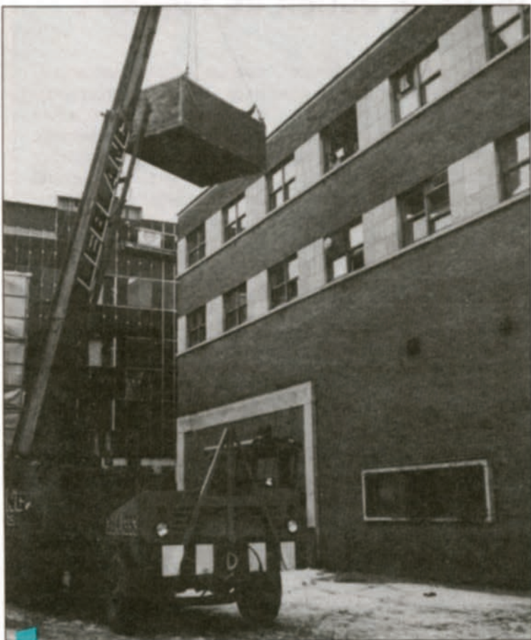
Après le Nouvel An, des pianos bien emballés.