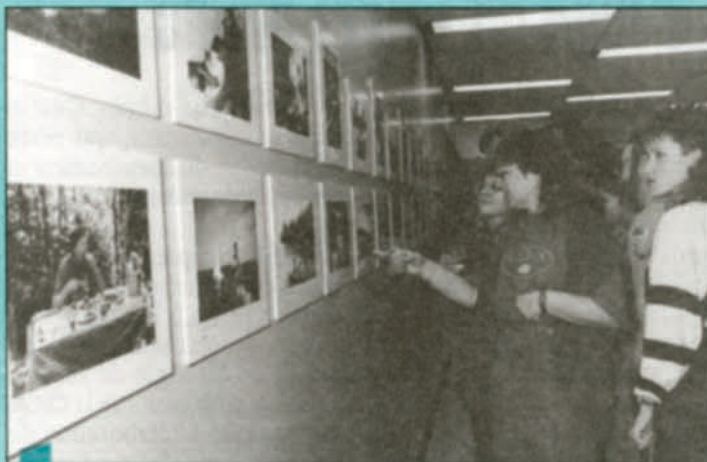
Concours de photos de vacances du service des bibliothèques.