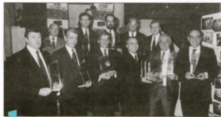
Les lauréats de la première édition pan-canadienne des Grands rapports annuels.

Les entreprises ont été recensées en fonction des neuf secteurs d'activités suivants: fabrication: produits industriels; fabrication: produits de consommation; pétrole, gaz et produits chimiques; mines, métaux et produits forestiers; technologie et communications, institutions financières; détail et gros; gestion et divers; services publics.