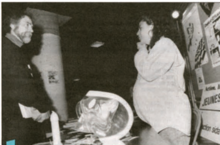
Journée mondiale du sida, fin novembre sur la grande place du pavillon Judith-Jasmin.

Dans le cadre de la journée mondiale du sida, le département de sexologie a organisé en collaboration avec le Comité sida aide Montréal une série d'activités (kiosques d'information, spectacles, animation, distribution de condoms) sur la grande place du pavillon Judith-Jasmin. Une vingtaine de groupes ont participé dont Action sida Laval, Cactus, le Comité des personnes atteintes du VIH et le Regroupement des CLSC. Selon le porte-parole Pierre Pilote, cette activité de deux jours a été un succès. "On n'a pas pro-