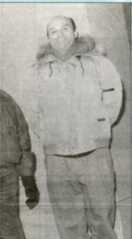
programmation des locaux.

toutes et chacune des personnes touchées par une relocalisation. Nos propositions, explique-t-il, cherchent à répondre aux besoins exprimés (lieu, nombre de mètres carrés, etc.) mais elles ne sont pas sans contraintes et, surtout, elles doivent tenir compte des balises tracées par le plan directeur de l'Université. Ceci dit, dans l'ensemble, nous parvenons à des ententes satisfaisantes avec les groupes qui doivent être relocalisés.