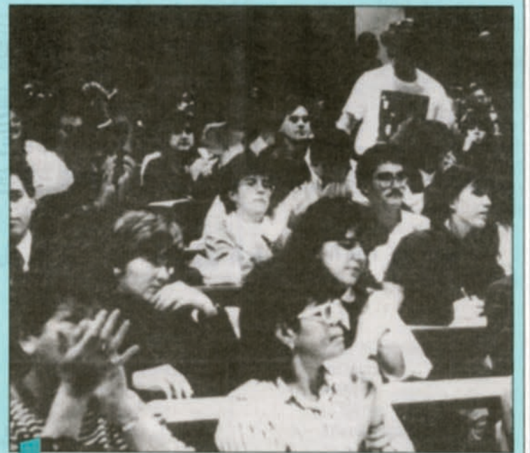
C'est la deuxième fois que la famille des lettres et communications présente un cours-événement culturel. Il y a deux ans, elle avait remporté un vif succès avec un cours-spectacle intitulé La culture québécoise est-elle exportable?

Ces cours-événements auront lieu les lundis à 17h30 au local A-M050. Quelques places sont encore disponibles. Pour s'inscrire, il suffit de se présenter à son module au plus tard le 17 janvier. Le sigle du cours: FLM 100D, groupe 10.