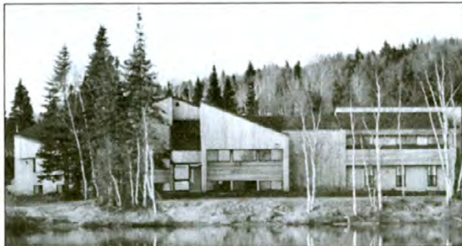
Situé au bord du Lac Lusignan, à Saint-Michel-des-Saints, le Centre écologique peut accueillir une centaine de visiteurs.

Rappelons que le Centre écologique est situé à Saint-Michel-des-Saints. Il comprend une quarantaine de chambres dont certaines avec salle de bain privée. Les prix sont plus qu'avantageux. Entre 59 $ et 72 $ par personne, en occupation double. Ces tarifs incluent l'hébergement avec literie, trois repas par jour, collation à volonté, animation et équipements récréatifs. C'est la firme Gescona inc. qui est chargée de la gestion du Centre.