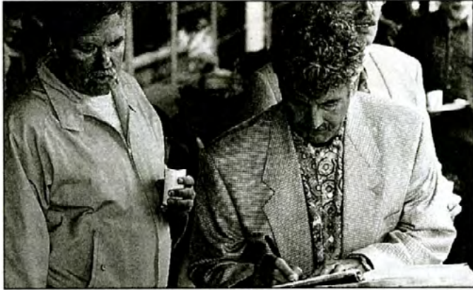
Les employés et professeurs ayant 25 ans d'ancienneté étaient invités à signer le livre d'or de l'UQAM, au petit déjeuner donné en leur honneur.