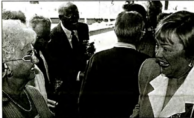
Les retraités se retrouvent avec joie lors d'un brunch en leur honneur.