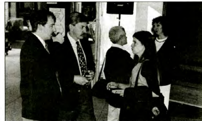
Les chargés de cours discutent ferme.