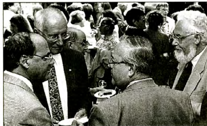
Quelques membres de la direction et professeurs échangent des propos en dégustant le gâteau du 25e anniversaire.