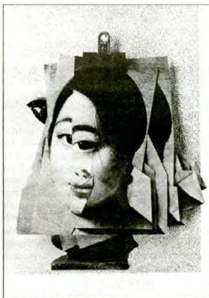
Jiri Kolar. Mots gelés. 1981.