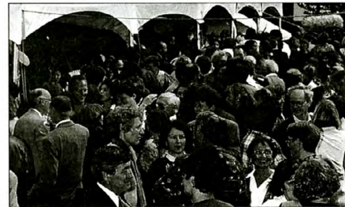
Une fête champêtre fort courue où régnait le plaisir de discuter avec des collègues.