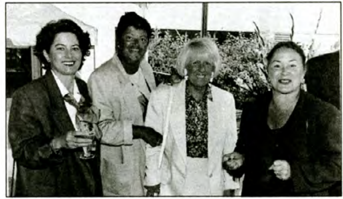
Des employés ayant 25 ans d'ancienneté fêtent dans la bonne humeur en compagnie de la vice-rectrice aux ressources humaines.