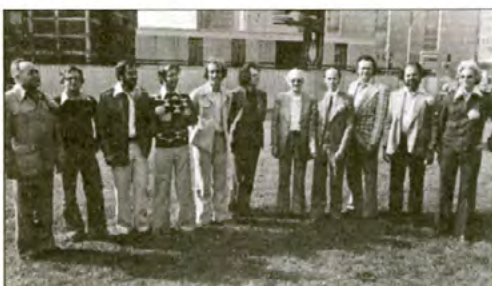
Les professeurs du département de sexologie devant le pavillon Read en 1978. Remarquez que la gent féminine était inexistante, à cette époque. On compte maintenant 5 femmes au département.