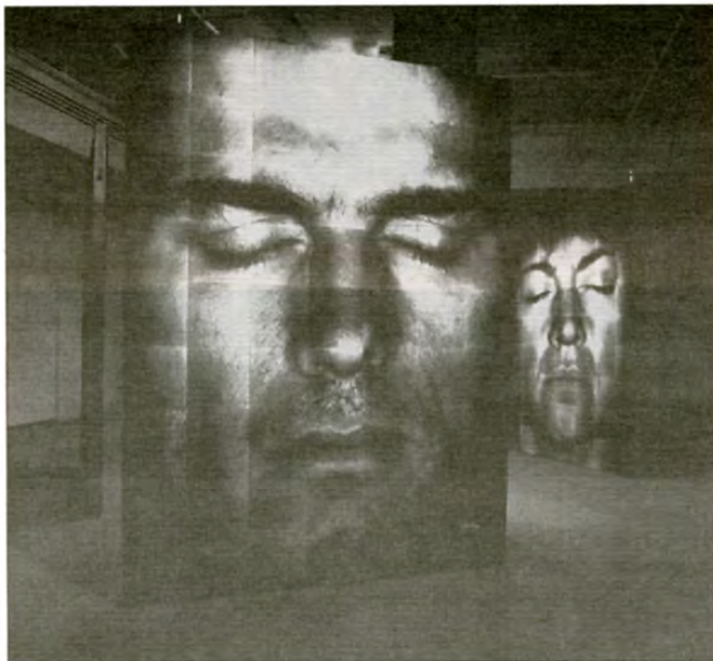
Roberto Pellegrinuzzi Série Les Écorchés , 1999

Dans le cadre du Mois de la photo à Montréal, la Galerie de l'UQAM offre à la communauté universitaire la possibilité de découvrir le tout nouveau travail de ce véritable « chasseur d'images » qu'est Roberto Pellegrinuzzi. La directrice de la Galerie, Mme Louise Déry, assure le commissariat de cette exposition qui se déroulera jusqu'au 9 octobre prochain. L'amateur d'art pourra y admirer, entre autres, les plus récentes recherches réalisées par l'artiste en macrophotographie. Il en va ainsi de la série Les Écorchés qui impliquent la restitution de tous les fragments d'un visage, photographié centimètre par centimètre, assemblés et épinglés de manière à en rabattre le modelé sur un seul plan, et dont le résultat, étrange et déroutant, draine la lecture dans de multiples directions.