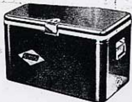
GLACIÈRES À PIQUE-NIQUE, À PARTIR DE $15.50