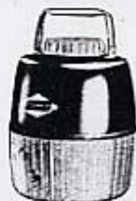
CRUCHES À PIQUE-NIQUE, À PARTIR DE $8.45